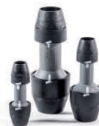
Белые индикаторы момента затяжки (серия PF)

2946700464 — © Апрель 2015 г. — Возможны изменения содержания без предварительного уведомления.